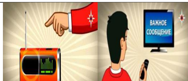
Включите радио, телевизор

Через уличные громкоговорители или другие средства оповещения будет передан звуковой сигнал оповещения. Непрерывное звучание сирены в течение трех минут или прерывистые гудки промышленных предприятий, организаций означают сигнал «Внимание всем!»